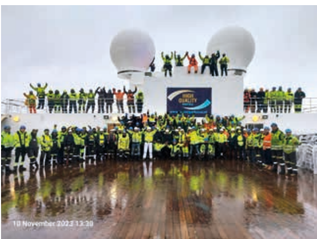
Grote foto links: Jack-house in de steigers en compleet in de krimpfolie. Bovenste foto: Bij de "splashzone" beginnen de steigers op een hoogte van 80 meter. Daaronder: Het team op het cruiseschip de Queen Mary.