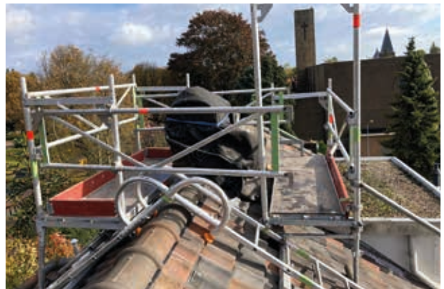
Schoorsteenrenovatie in Bussum (NL) met de Layher dakladderconsoles.