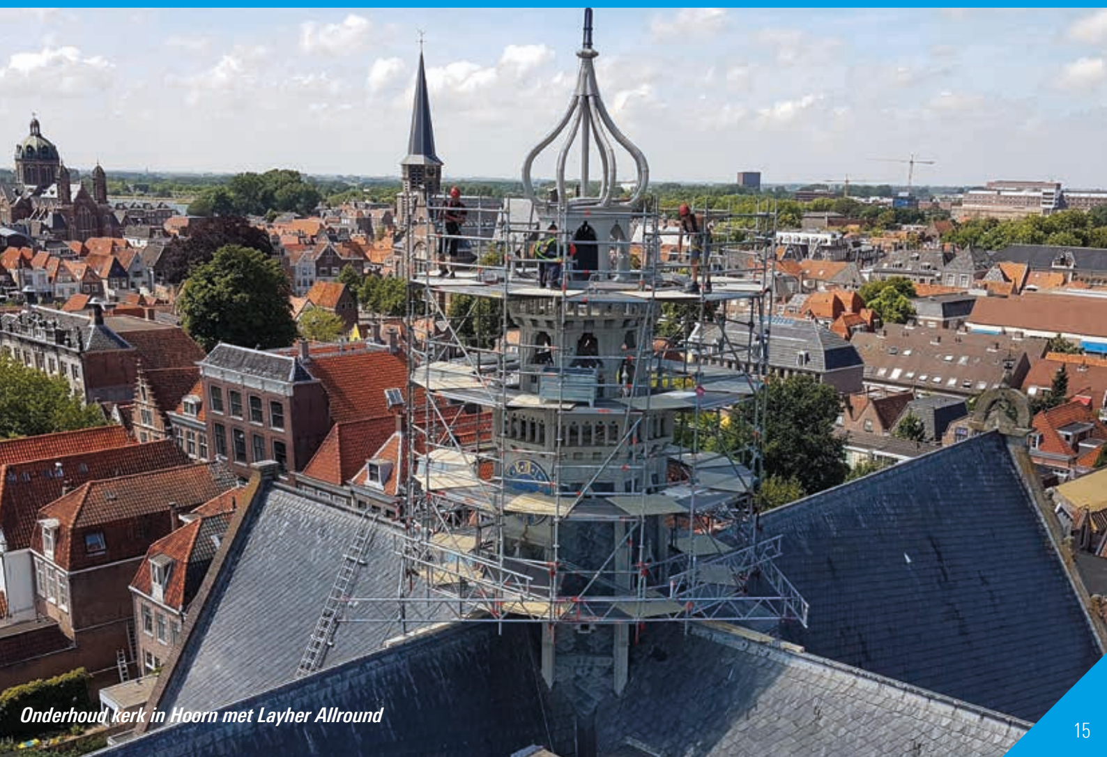
Onderhoud kerk in Hoorn met Layher Allround