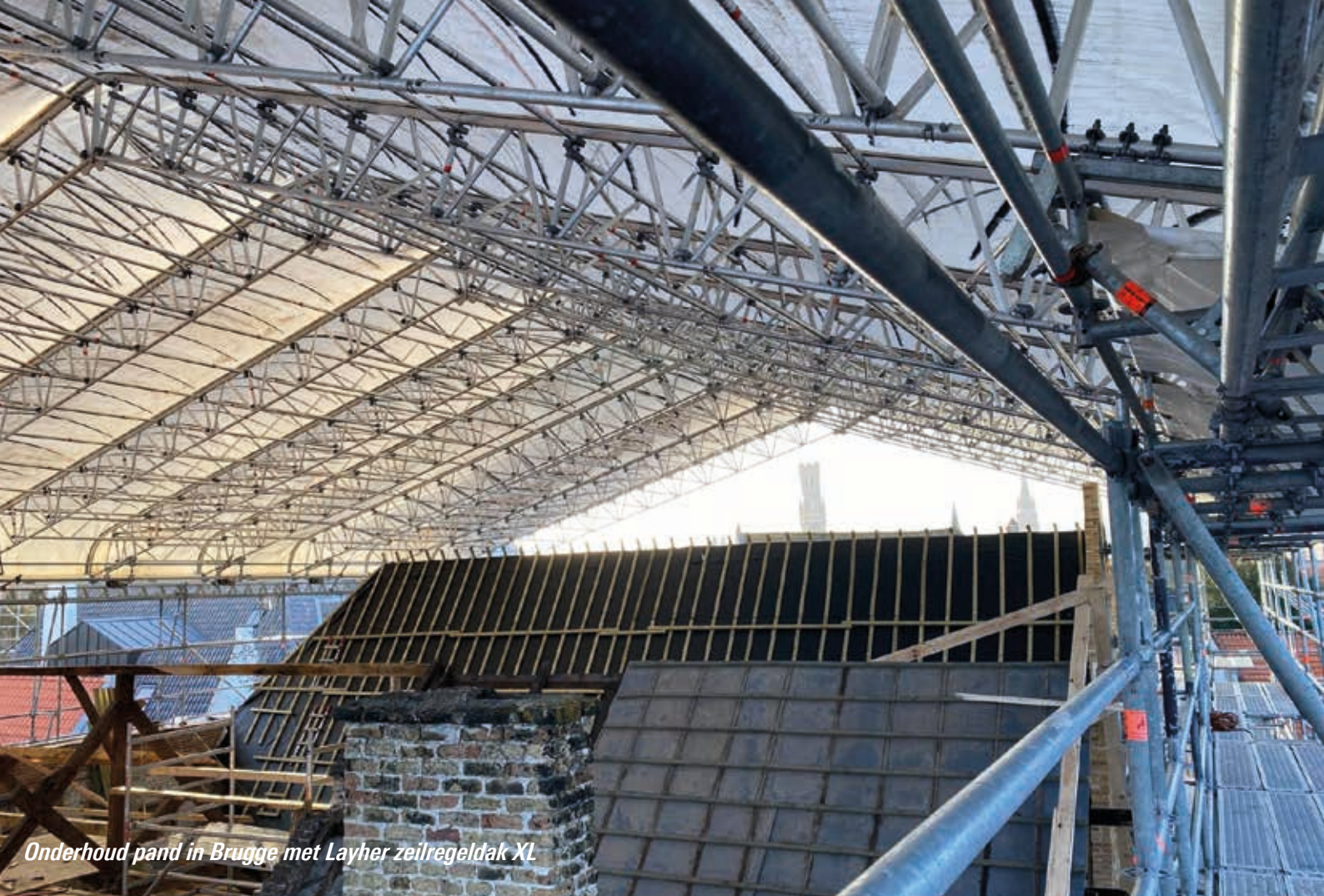
Onderhoud pand in Brugge met Layher zeilregeldak XL